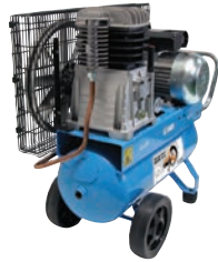
DECO TURBO 75/22T