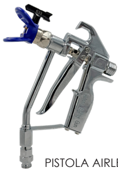
PISTOLA AIRLESS: AG 700

El equipo Airless JAFE 5500 T es aún más versátil. Permite pulverizar pintura o masilla en aplicaciones intensas. Adecuado para aplicaciones con múltiples pistolas o trabajos de impermeabilización y enlucido que requieren mangueras extensas.